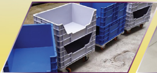
บรรจุของได้เยอะ

เหมาะกับการเคลื่อนย้ายในที่แคบๆทำให้พื้นที่ในการทำงานเกิดประโยชน์สูงสุดโดยใช้รถเข็น ต่อพ่วง