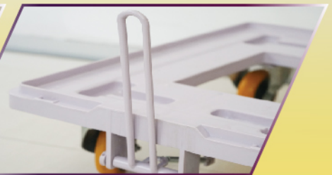
อุปกรณ์เกี่ยวพ่วง